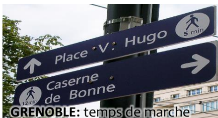
GRENOBLE: temps de marche