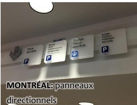
MONTRÉAL: panneaux directionnels