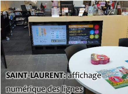
SAINT-LAURENT: affichage numérique des lignes