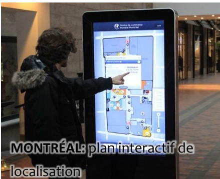
MONTRÉAL: plan interactif de localisation