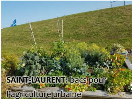
SAINT-LAURENT: bacs pour l'agriculture urbaine