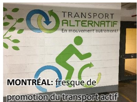
MONTRÉAL: fresque de promotion du transport actif