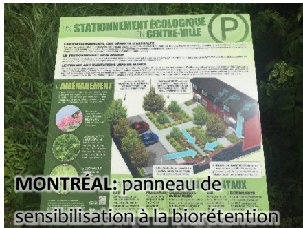
MONTRÉAL: panneau de sensibilisation à la biorétention