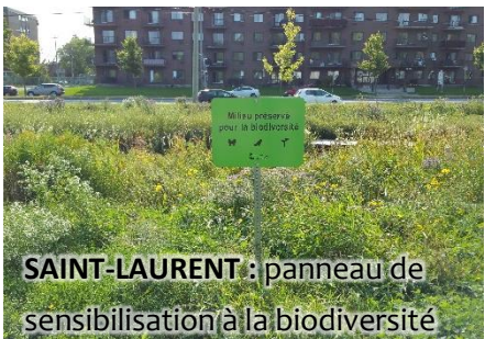
SAINT-LAURENT: panneau de sensibilisation à la biodiversité