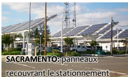
SACRAMENTO: panneaux recouvrant le stationnement