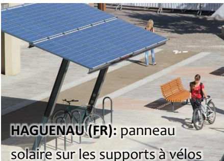
HAGUENAU (FR): panneau solaire sur les supports à vélos