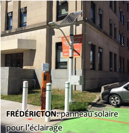
FRÉDÉRICTON: panneau solaire pour l'éclairage