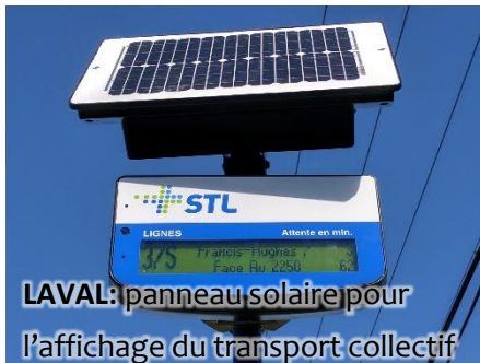
LAVAL: panneau solaire pour l'affichage du transport collectif