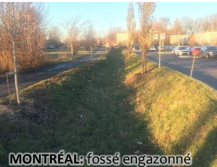
MONTREAL: fossé engazonné