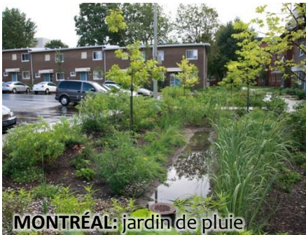
MONTREAL: jardin de pluie