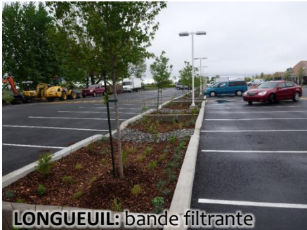
LONGUEUIL: bande filtrante