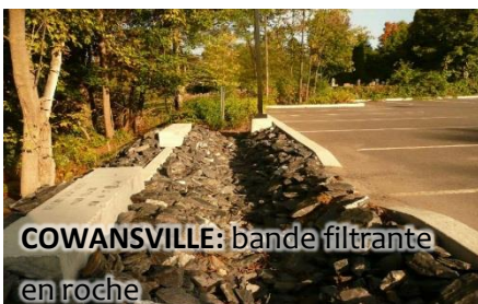
COWANSVILLE: bande filtrante en roche