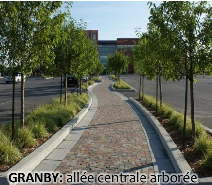
GRANBY: allée centrale arborée