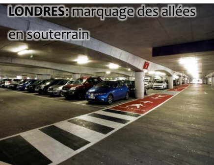
LONDRES: marquage des allées en souterrain