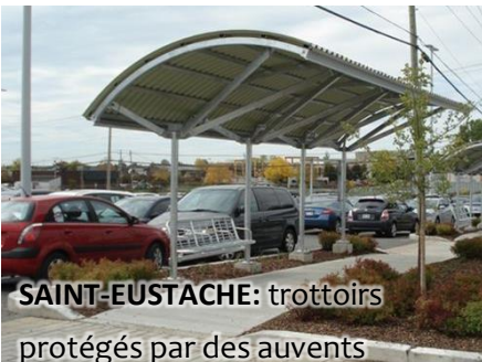
SAINT-EUSTACHE: trottoirs protégés par des auvents