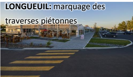
LONGUEUIL: marquage des traverses piétonnes