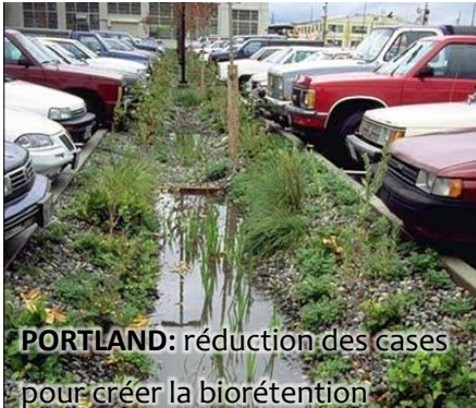
PORTLAND: réduction des cases pour créer la biorétention