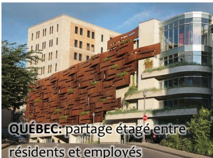
QUÉBEC: partage étagé entre résidents et employés