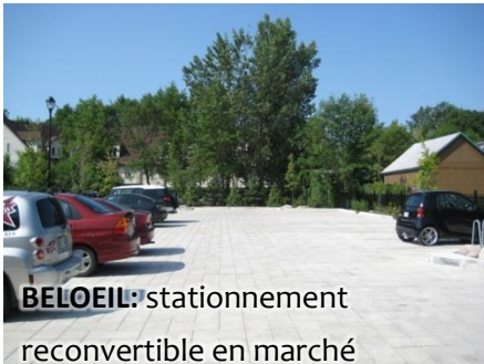
BELOEIL: stationnement reconvertible en marché