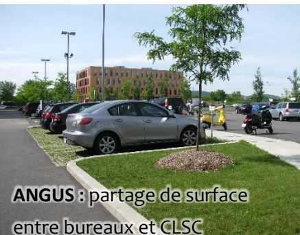
ANGUS: partage de surface entre bureaux et CLSC