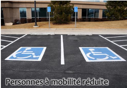
Personnes à mobilité réduite