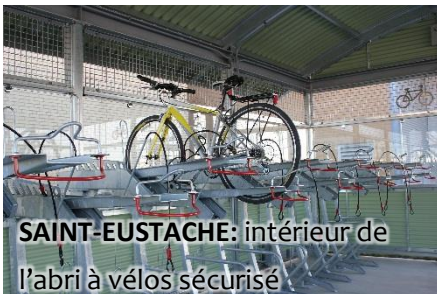
SAINT-EUSTACHE: intérieur de l'abri à vélos sécurisé