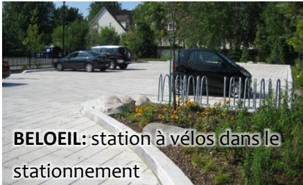
BELOEIL: station à vélos dans le stationnement