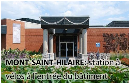
MONT-SAINT-HILAIRE: station à vélos à l'entrée du bâtiment