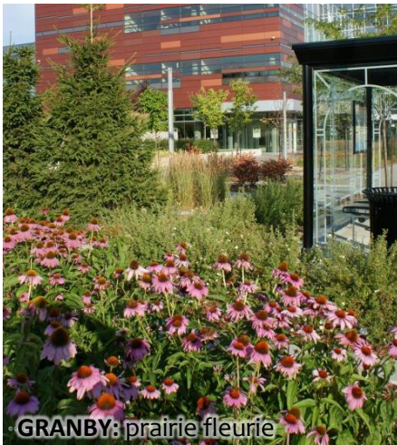
GRANBY: prairie fleurie