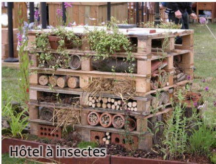
Hôtel à insectes